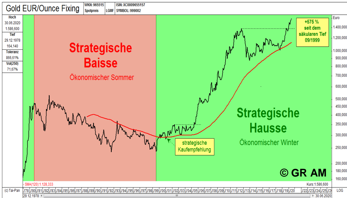
Abb. 4: Goldpreis in EUR/Unze (vor 1999 ECU) auf Monatsschlusskursbasis von 12/1978 - 06/2020