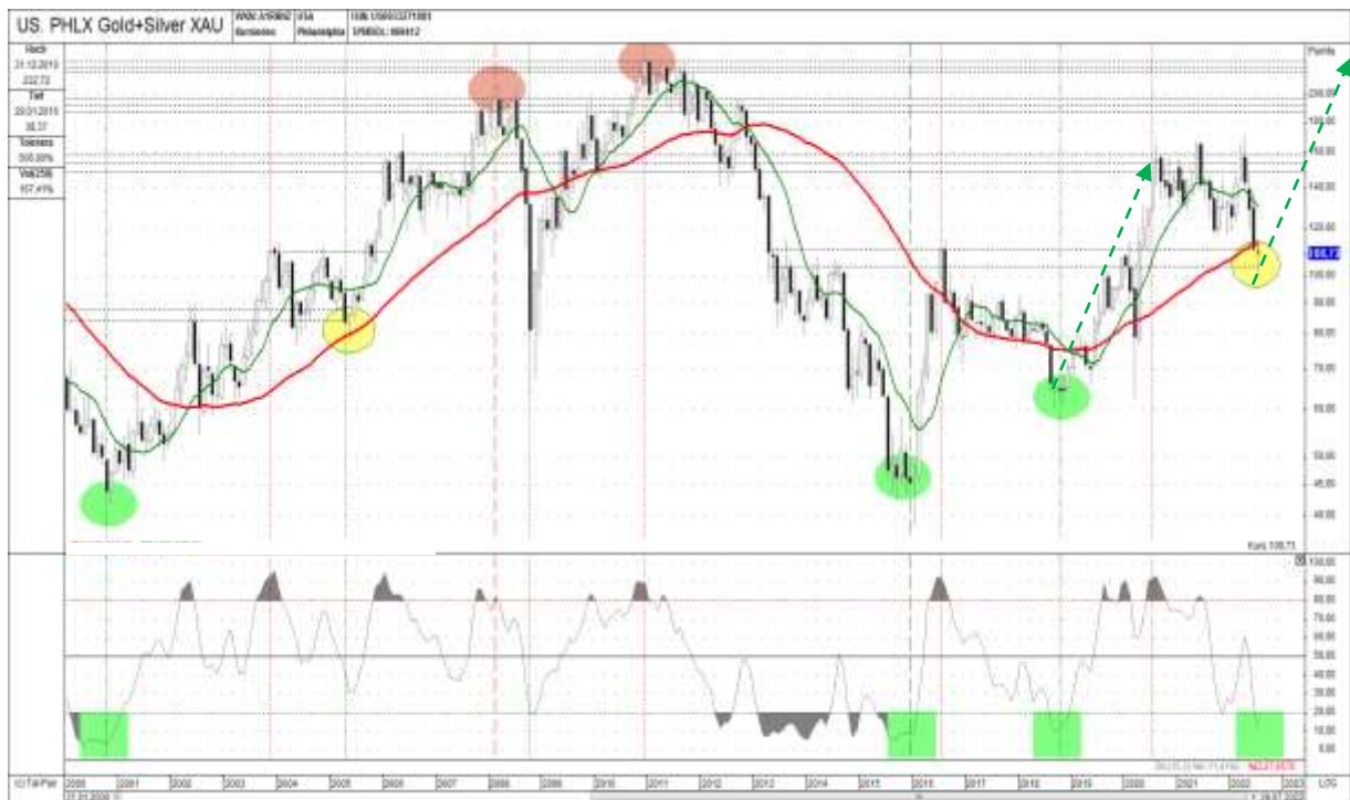
Abb. 3: XAU-Gold-&Silberminen-Index inkl. Momentum (monthly) von 06/1996 bis 06/2022

„Die Lüge regiert die Welt, seit Anbeginn der Zeit. Wer nie in eine Zeitung blickt, ist besser informiert als jemand, der sie liest. Denn wer nichts weiß, ist näher bei der Wahrheit als jemand, dessen Kopf mit Lügen und Irrtümern gefüllt wird. Nichts kann mehr geglaubt werden, was in der Zeitung steht. Die Wahrheit selbst wird verdächtig, wenn sie in dieses verschmutzte Gefährt gesteckt wird. Das wahre Ausmaß des Zustands der Falschinformation ist nur jenen bekannt, die sich in der Situation befinden, Tatsachen innerhalb ihres Wissensbereiches, mit den Lügen des Tages vergleichen zu können.“